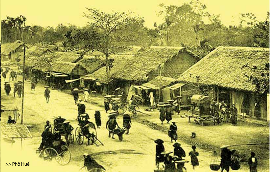
>> Phố Huế