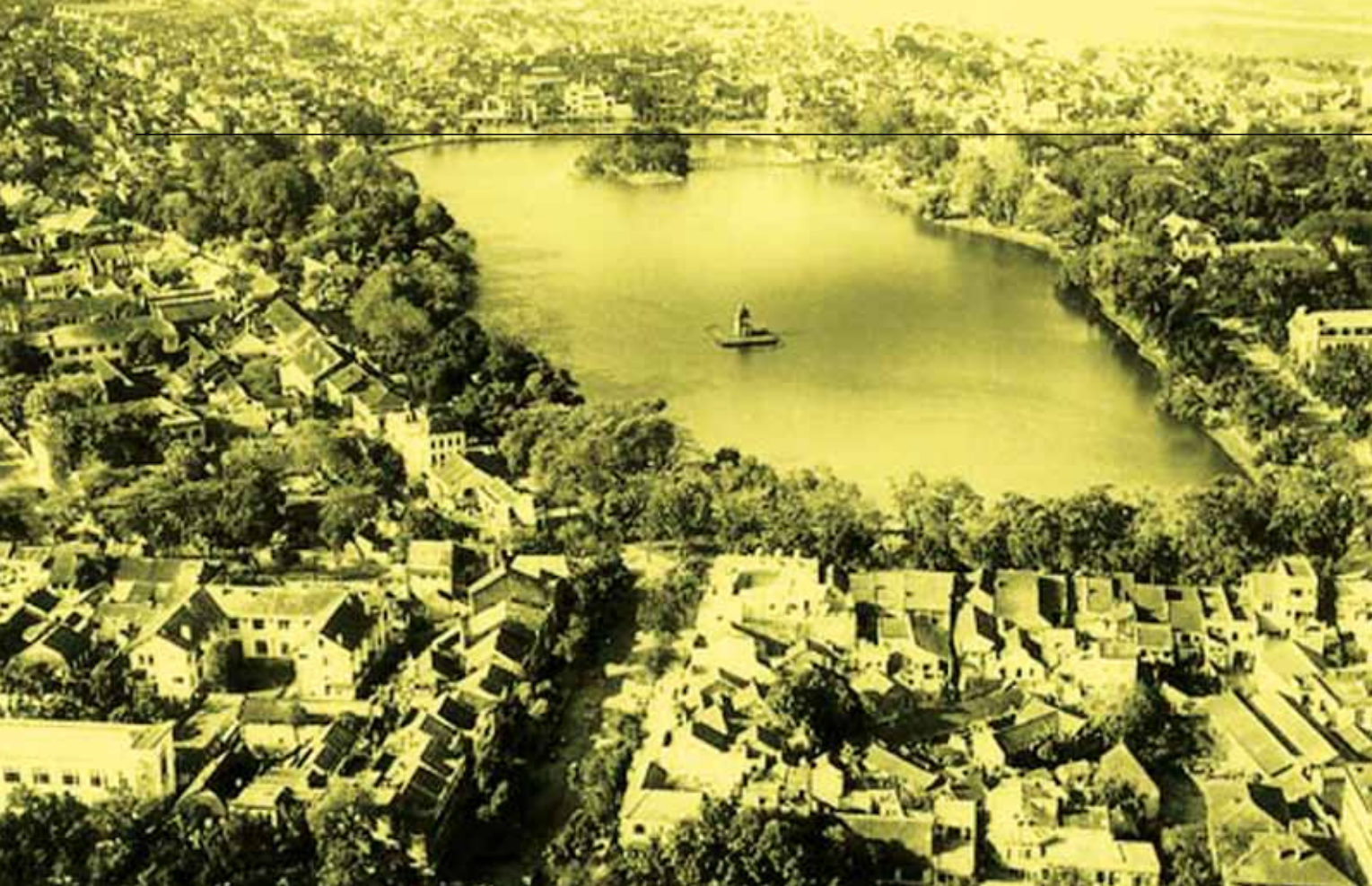
>> Toàn cảnh Hồ Gươm