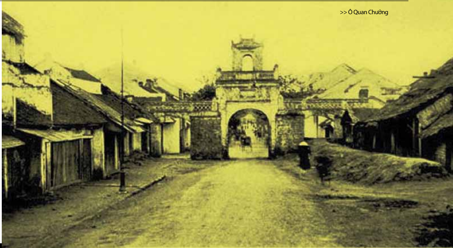
>> Ô Quan Chưởng