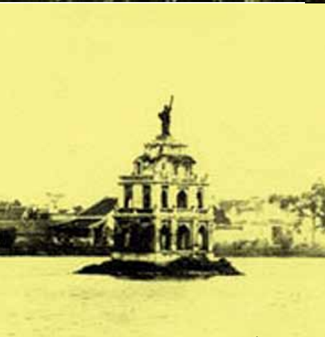
>> Tháp Rùa khi còn có tượng Nữ thần Tự Do