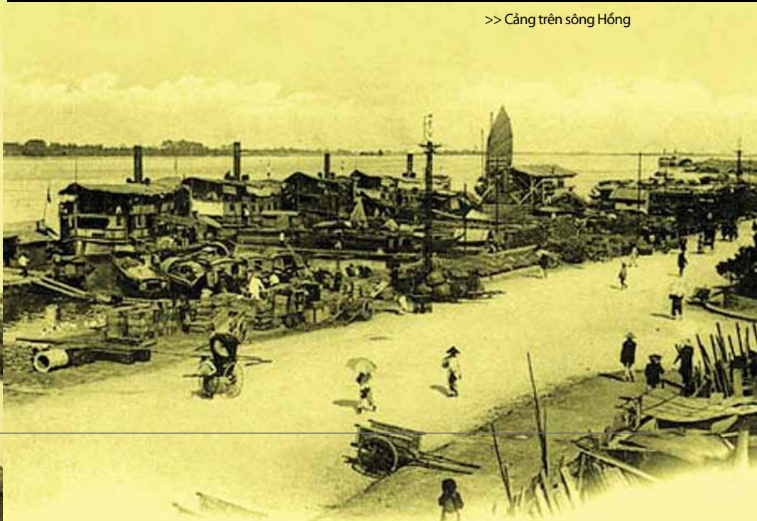
>> Cảng trên sông Hồng