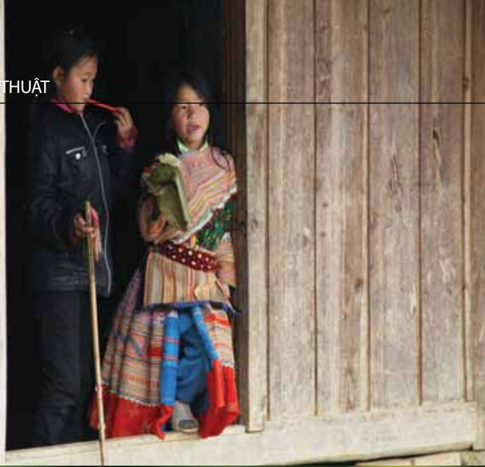
>> Trẻ em dân tộc H'Mông tại Bản Phố