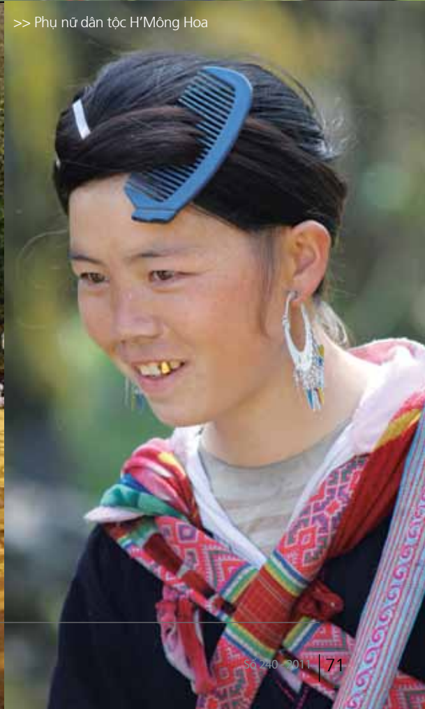
>> Phụ nữ dân tộc H'Mông Hoa