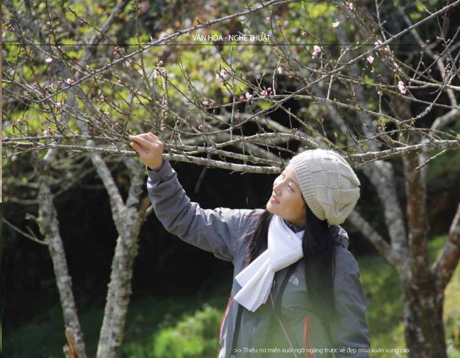
>> Thiếu nữ miền xuôi ngó ngang trước vẻ đẹp mùa xuân vùng cao