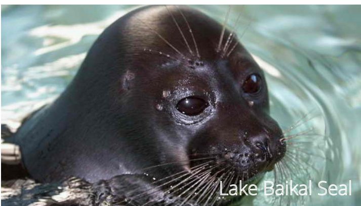
Lake Baikal Seal

Recognizing the importance of Baikal for the Irkutsk Region and the entire planet, INRTU perceives the importance of saving Baikal and its unique nature with endemic species of fish and animals and rare plants in a state of nature for future generations and protecting the lake from harmful human influence. For these reason, INRTU is committed on establishing effective educational programs and doing research in the field of ecology and green engineering.