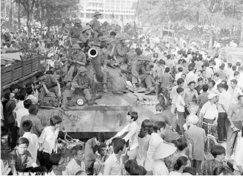
Nhân dân Sài Gòn đổ ra đường đón chào quân giải phóng chiếm Phủ tổng thống ngay, trưa 30/4/1975.