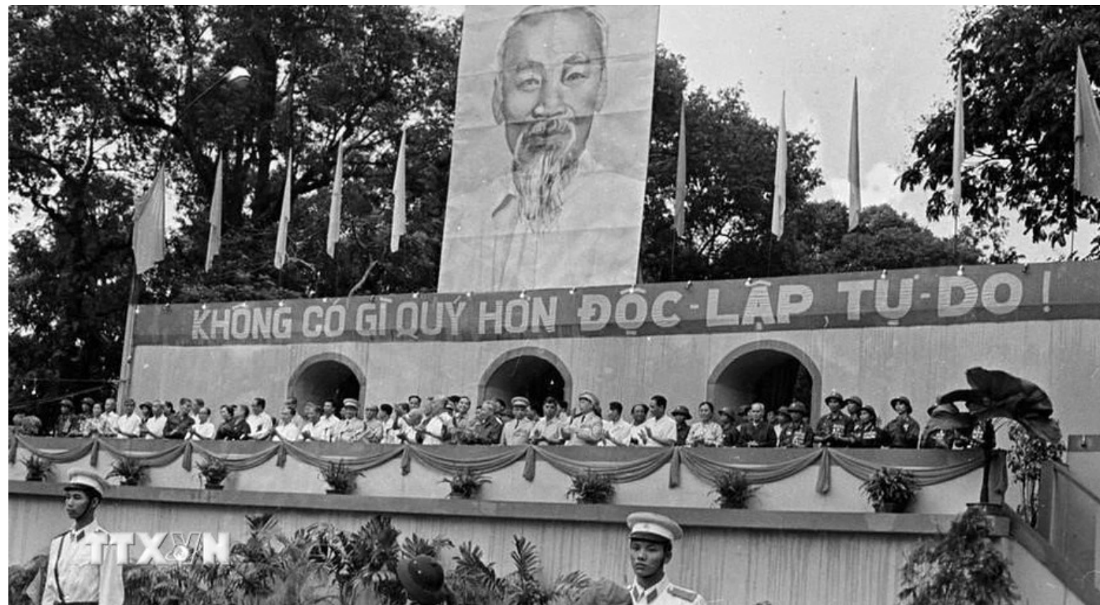
Sáng 15/5/1975, hàng triệu nhân dân Sài Gòn - Gia Định đổ về quảng trường trước trụ sở Ủy ban Quân quản thành phố để dự lễ mừng chiến thắng. Chủ tịch Tôn Đức Thắng cùng nhiều lãnh đạo Đảng, Chính phủ, Ủy Ban Mặt trận Tổ quốc Việt Nam tham dự buổi lễ.

con người tới sự hòa hợp dân tộc là một điều cần lưu ý.